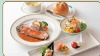
▲料理一例 オードブル、スープ、サラダ、メインディッシュ、パンまたはライス

センター側からグラウンドを一望しながらシェフ特製のコース料理に舌鼓👏!メインは肉・魚・日替わり限定料理の3種類から選べます。