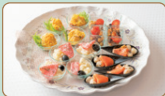
▲オードブル一例(4名様分)

オードブルをつまみながらゆっくりと野球観戦を楽しめるので、ファミリーやグループにおすすめ。