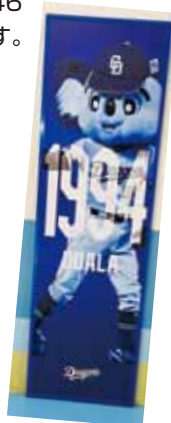
ドラア 2階3塁側総合案内所付近