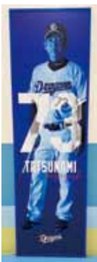
2階1塁側本塁付近 立浪監督

さらに場内コンコースには立浪監督や選手のパネルがあります。主力選手のほか、育成選手を含む若竜たちやドラアの姿も！ 2階46枚、5階36枚の全配置図はドーム公式サイトでご確認いただけます。