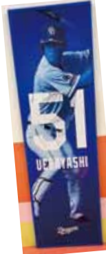
上林外野手 2階3塁側40通路付近