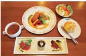
コースの一例(メインは魚料理)

ナイターでは本格コース料理、デーゲームではセミバイキング形式の食事が楽しめます。なおナイターのコース料理は、すべてスタッフが席まで配膳します。